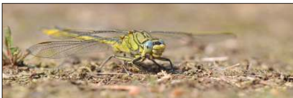
Plasrombouden ( Gomphus pulchellus ) bleken erg talrijk en makkelijk te benaderen.