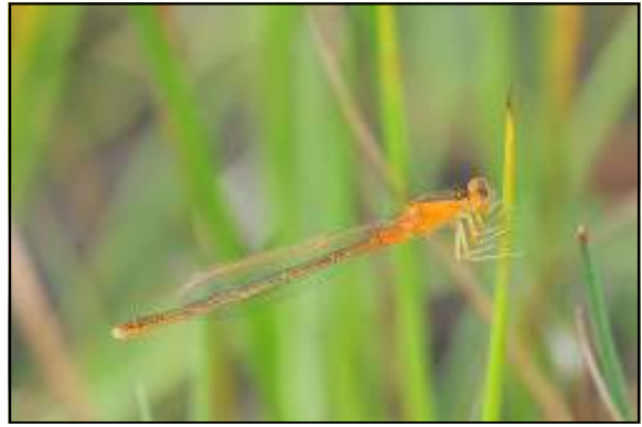
Tengere grasjuffer ( Ischnura pumilio ) was talrijk en actief bij een ondiepe plas.

landje van ANB in het domein. We observeerden hier de Vroege glazenmaker ( Aeshna isocles ) in de lucht. De groene ogen waren dan ook een zeer opvallend determinatiekenmerk. Verder vlogen hier nog enkele Blauwe breedscheenjuffers ( Platynemis pennipes ), Viervlekken ( Libellula quadrimaculata ) en 1 man Grote keizerlibel ( Anax imperator ). Verderdoor kwamen we aan de Echelkuilen. Hier werden vroeger 'echels' gekweekt, bloedzuigers die bij apothekers verkocht werden voor bloedaflating. Hier keken we met de verrekijker naar enkele Glassnijders ( Brachytron pratense ). Ook de Gewone oeverlibel ( Orthetrum cancellatum ), Vier-vlek ( Libellula quadrimaculata ), Azuurwaterjuffer ( Coenagrion puella ) en Lantaarntje ( Ischnura elegans ) vlogen boven de plas. Daarna bezochten we de ANB-vijver aan de 'bosvilla Misonne'. Hier konden we geen nieuwe soorten meer toevoegen aan onze lijst. De Glassnijder ( Brachytron pratense ) was hier goed vertegenwoordigd met 5 mannetjes en 1 wijfje. Grote roodoogjuffers ( Erythromma najas ) kwamen hier in grote getalen voor, en af en toe een Grote Keizerlibel ( Anax imperator ). Verschillende Smaragdlibellen ( Cordulia aenea ) waren hier nog eitjes aan het afzetten.