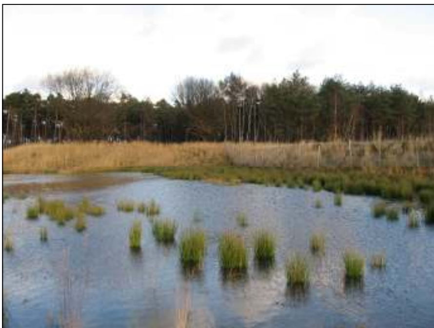
Foto 1: Winters beeld van de waterplas op het ecoduct Kikbeek op 3 december 2007.

Er zijn tal van onderzoeksmethodieken gebruikt om een zo volledig mogelijke kijk te bekomen op de passerende fauna. Daarvan zijn er 3 continue methodes: video-opnames, bodemvallen en een datalogger. Alle andere methodes zijn geconcentreerd in 11 intensieve meetperiodes die telkens 3 opeenvolgende dagen in beslag namen. Het gaat om sporenonderzoek op zandbedden, op inktplaten en verspreid over het ecoduct en daarnaast ook controle van ‘slangenplaten’. Het lopen van monitoringsroutes voor insecten en batdetec-