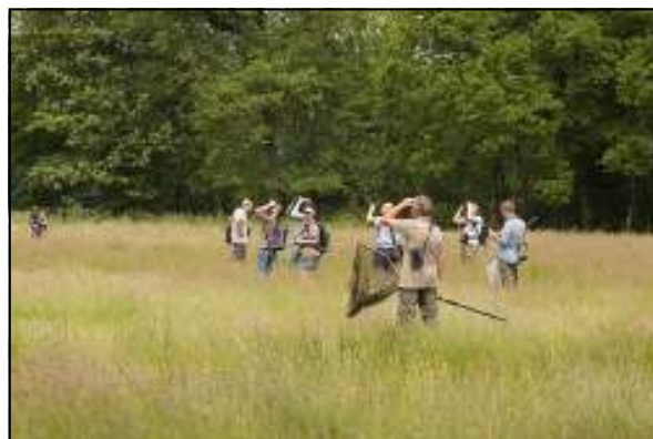
De hele groep kijkt enthousiast naar de hoog vliegende Vroege glazenmaker.

Allereerst bezochten we domein Misonne dat enkele jaren geleden aangekocht werd door ANB (vroeger Aminoal). We wandelden naast de rivier Aa en observeerden een vrouwtje Bosbeekjuffer ( Calopteryx virgo ), Weidebeekjufer ( Calopteryx splendens ), man Vuurjuffer ( Pyrrhosoma nymphula ) en een Plasrombout ( Gomphus pulchellus ). We hadden wel wat meer Bosbeekjuffers verwacht! Daarna bezochten we een hooi-