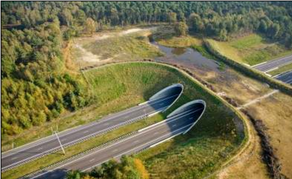
Foto 2. Luchtfoto Ecoduct Kikbeek op 15 oktober 2007, genomen vanuit het zuidwesten. Voor de aandachtige waarnemer: Jorg Lambrechts en Wouter Mewis waren net op dat moment aan het inventariseren...