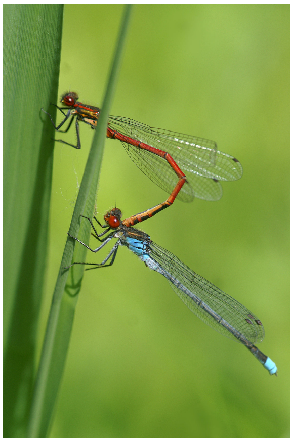
Een kleurrijke verigssing: een mannetje Vuurjuffer ( Pyrrhosoma nymphula ) probeert te paren met een mannetje Grote roodoogjuffer ( Erythromma najas )