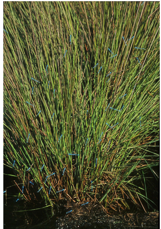
Pollenvormende grassen, structuurkenmerken van levensbelang voor rustende waterjuffers.

Literatuur: Ketelaar, R. & Pontenagel, G.J. (2000). Waar overnacht de speerwaterjuffer Coenagrion hastulatum ? Brachytron 4(2): 20-22. / Rouquette, J.R. & Thompson, D.J. (2007). Roosting site selection in the endangered damselfly Coenagrion mercuriale , and implications for habitat design. Journal of Insect Conservation 11(2): 187-193