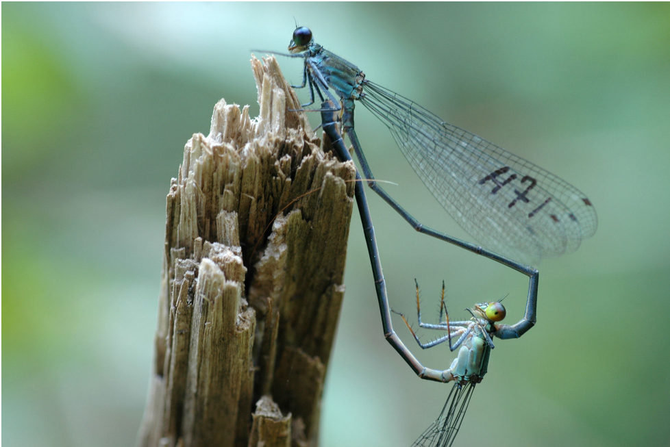
Foto 3: Paringswielen van N. heteroneura : op sommige locaties werden gelijke aantallen mannetjes en vrouwtjes aangetroffen, terwijl op andere locaties veel vrouwtjes maar slechts enkele mannetjes werden waargenomen.

Aangekomen te Fiji werden ze niet enkel geconfronteerd met een unieke fauna en flora maar werden ze ook cultureel ondergedompeld. Ongeveer de helft van de bevolking in Fiji is oorspronkelijk, terwijl de andere helft van Indische oorsprong is. Het merendeel van het land in Fiji is in handen van de oorspronkelijke bevolking, de Indiërs hebben het land in bruikleen. De avontuurlijke wetenschapper dient eerst uit te zoeken bij welk dorp een stukje natuur hoort en vervolgens op zoek te gaan naar het dorps hoofd. Toelating tot het land kan verkregen worden na het overhandigen van een gift (een bundel wortels van de kavaplant) en het samen drinken van kava (een modderig smakend aftreksel waarvoor de wortels van de kavaplant worden gebruikt) met de dorpelings. Het samen zijn met de dorpelings laat toe om je verhaal en de reden van je bezoek te vertellen en het dorpsleven te ervaren.