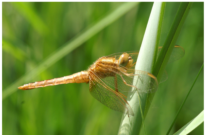
Een zeer jong mannetje van de Vuurlibel ( Crocothemis erythraea )