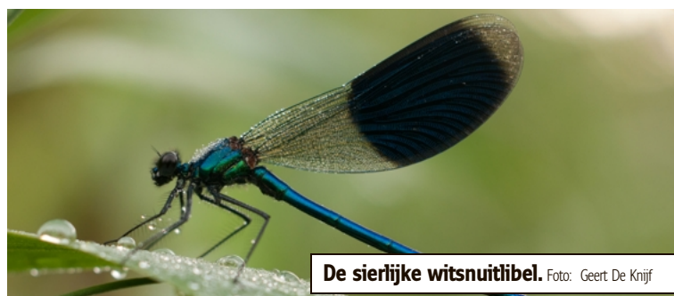
De sierlijke witsnuitlibel.

De eerste nieuwe waarneming van de sierlijke witsnuitlibel gebeurde precies twee jaar geleden in Lommel. Vorige week werd opnieuw een mannetje gespot. Kenners durven te spreken van de aanwezigheid van een kleine populatie van deze beschermde soort.