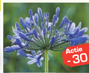
Agapanthus in soorten (Afrikaanse lelie in verschillende maten)