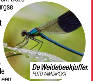
De Weidebeekjuffer.