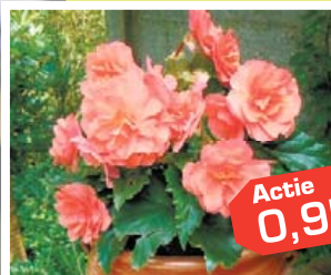
Knolbegonia staande & hangende (in verschillende kleuren, pot 12 cm.) € 1,49

Hortensia's -15 % Alle maten en kleuren. Acties van 27 mei t/m 9 juni