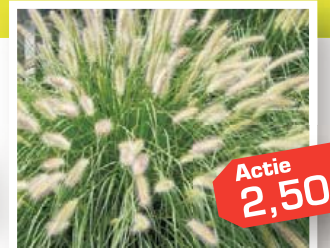
Pennisetum 'Hameln' (lampenpoetsgras pot 2 liter) € 3,95